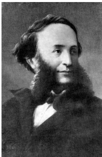
И. К. Айвазовский. Фотопортрет

Статья Шумовой М.Н. и портреты художника