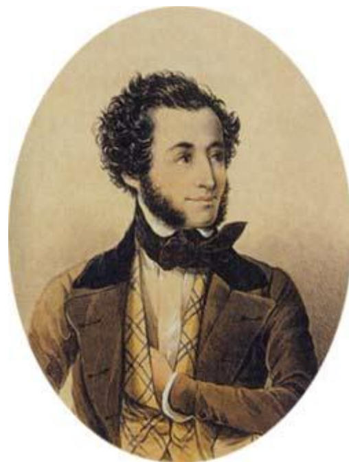
Портрет И.К.Айвазовского работы С. А. Рымаренко. 1846 г.

Айвазовский, И. К. (1817 - 1900) - известный русский художник. Окончил Академию Художеств в 1843 г. В 1847 г. получил звание профессора живописи. Считается одним из лучших художников-маринистов. В 1874 г. во Флоренции была устроена выставка произведений Айвазовского, доставившая ему мировую известность.