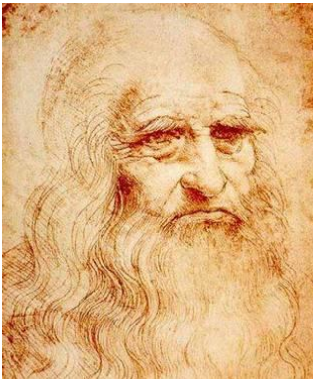
Леонардо да Винчи. Автопортрет. 1511

«Как хорошо прожитый день даёт спокойный сон, так с пользой прожитая жизнь даёт спокойную смерть» Леонардо да Винчи