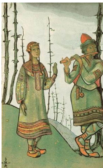
«Снегурочка и Лель»

«Русских сезонах» в Париже. Декорации Рериха к «Половецким пляскам» из оперы А. П. Бородина «Князь Игорь» (1909) поразили парижскую публику. Всего в дореволюционные годы художником было оформлено более 10 спектаклей. В их числе опера Н. А. Римского-Корсакова «Снегурочка», балет И. Ф. Стравинского «Весна священная», пьесы М. Метерлинка «Принцесса Малэн» и «Сестра Беатриса», драма Г. Ибсена «Пер Гюнт».