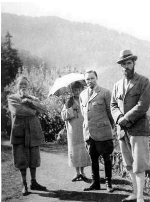
Семья Рерихов в Кулу

В 1916 году в связи с тяжелой болезнью, Рерих покинул Петроград и поселился в Карелии, в городе Сердоболе (Сортавала). В 1918-1919 гг. художник жил в Выборге. В это время его персональные выставки прошли в Швеции, Финляндии, Норвегии, Дании, Англии. В 1920-1923 гг. художник с огромным успехом совершил большое выставочное турне по городам США. В 1923 г. он вернулся в Европу.