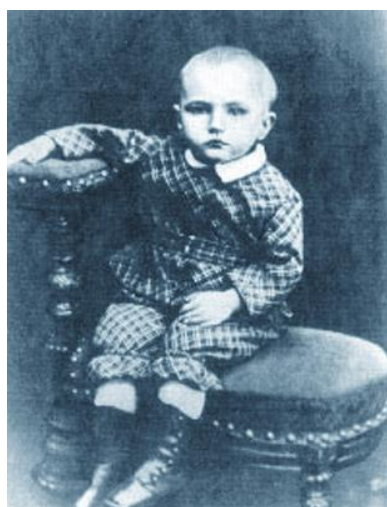
Николай Рерих в детстве.