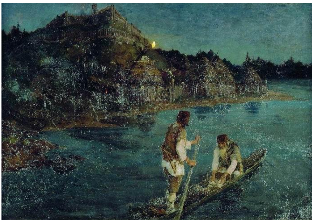
Гонец. Восстал род на род

В 1897 г. он окончил АХ, получив звание художника за картину «Гонец. Восстал род на род». Это произведение, в котором выразилась горячая любовь Рериха к русской истории и природе, сразу привлекло к себе внимание художественной общественности, было высоко оценено критикой. П. М. Третьяков приобрел полотно в свою коллекцию.