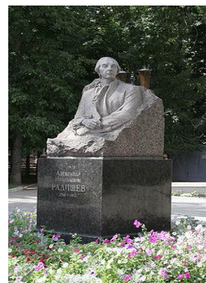
Бюст А. Н. Радищева у входа в Саратовский художественный музей