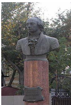
Памятник А. Н. Радищеву в Москве на ул. В. Радищевская

В Москве существуют улица Верхняя и Нижняя Радищевская, на Верхней стоит памятник писателю и поэту. Улица Радищева есть в Центральном районе Санкт-Петербурга. Памятник в виде бюста установлен на родине А. Н. Радищева, в городе Саратове, где стараниями его внука — великого художника-мариниста А. П. Боголюбова — был открыт первый провинциальный общедоступный художественный музей, который увековечил память «первого освободителя русского народа».