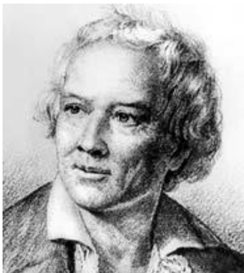
Глюк К. В.

В 1745 году Глюк едет в Лондон, где ставит оперы «Падение гигантов» и «Артамена», а также пастиччо «Пирам и Тисба», составленное из лучших мест его прежних опер; но лондонская публика отнеслась к его операм довольно холодно, и, разочарованный своей неудачей, он уезжает вскоре из Англии, унося с собой впечатление от знакомством с Генделем. Прожив некоторое время в Дрездене, где в 1748 году была поставлена его опера «Узнанная Семирамида», Глюк поселяется в Вене. С этого времени появляются оперы «Телемак» (Рим, 1750), «Милосердие Тита» (Неаполь, 1751), «Китайки» (Вена, 1755) и др.