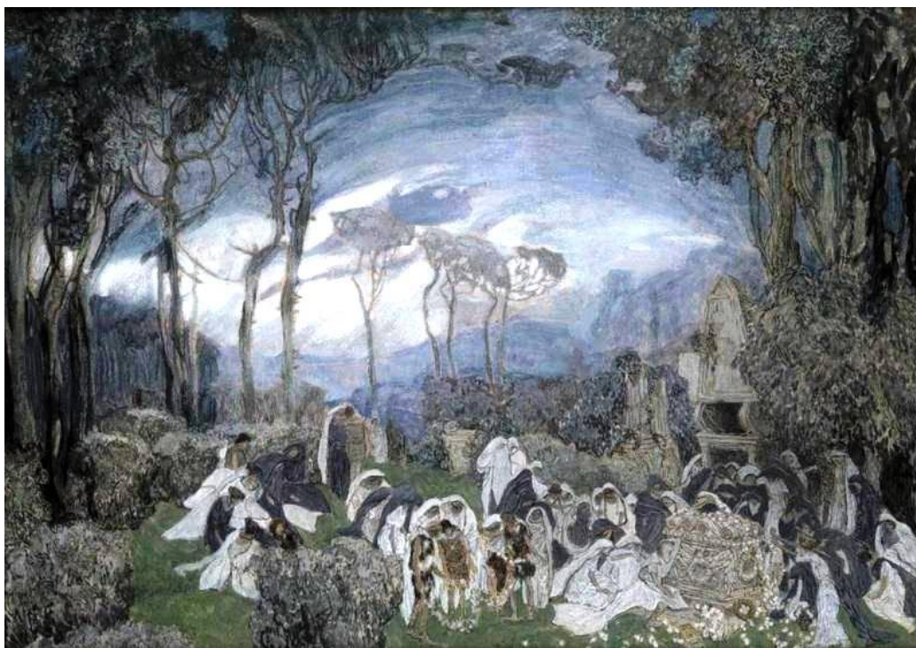
Картина Головина: Эскиз декорации к опере «Орфей и Эвридика»

С 1762 года деятельность Глюка резко изменилась и принимает направление, благодаря которому за ним остается значение реформатора в деле оперной музыки и благодаря чему он играет такую большую роль в истории развития оперы. Стремление к тесной связи между музыкой и текстом заметно у Глюка уже в «Семирамиде», но более осязательный поворот композитора к опере как музыкальной драме определяется в «Орфее», поставленном в Вене в 1762 году. В своих прежних операх Глюк почти ничем не отличается от других итальянских композиторов; начиная с «Орфея», он является вполне самобытным талантом, в трудах которого нет больше места инстинктам, хотя бы и гениальным; напротив того, все рассчитано, все является результатом знаний, стремлений и громадной опытности, гениально проведенных в его позднейших произведениях. Трудно сказать, под влиянием чего развился драматический талант Глюка.