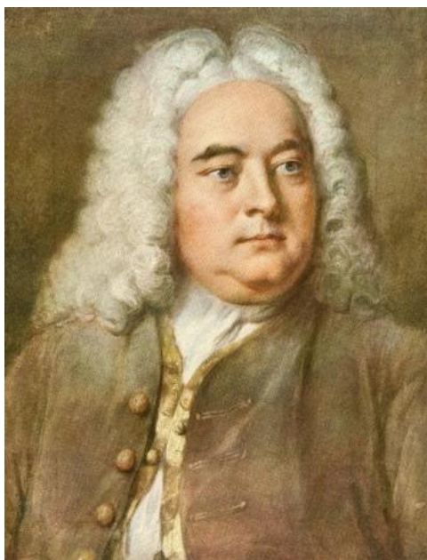
Георг Фридрих Гендель

Занятый проведением своей оперной реформы, Глюк поехал в Париж, где рассчитывал найти подходящую арену для своей деятельности. Во Франции публика была уже подготовлена к проведению драматической тенденции в опере композиторами Люли и Рамо. При содействии члена французского посольства в Вене Бальи дю Ролле Глюку удалось положить на музыку «Ифигению в Авлиде» Расина, но долго и безуспешно пришлось хлопотать о постановке этой оперы на парижской сцене. Наконец композитор добился разрешения ее постановки через посредство своей бывшей ученицы дофины Марии-Антуанетты. Опера эта была поставлена в 1773 году, и с каждым разом успех ее все увеличивался.