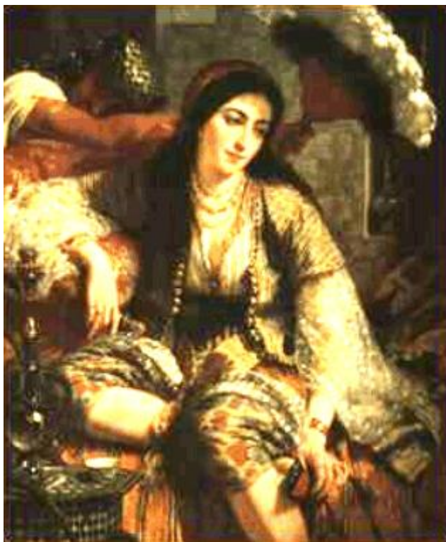
Семирамида, царица Ассирии

В 1745 году Глюк едет в Лондон, где ставит оперы «Падение гигантов» и «Артамена», а также пастиччо «Пирам и Тисба», составленное из лучших мест его прежних опер; но лондонская публика отнеслась к его операм довольно холодно, и, разочарованный своей неудачей, он уезжает вскоре из Англии, унося с собой впечатление от знакомством с Генделем. Прожив некоторое время в Дрездене, где в 1748 году была поставлена его опера «Узнанная Семирамида», Глюк поселяется в Вене. С этого времени появляются оперы «Телемак» (Рим, 1750), «Милосердие Тита» (Неаполь, 1751), «Китайки» (Вена, 1755) и др.